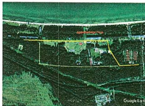
— neue Wegführung Radverkehr - - - - bestehende Wegführung Radverkehr auf der Mukraner Straße