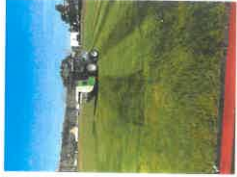
Naturrasenplatz nach dem Vertikutieren