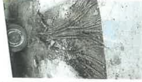
Vorbereitende Arbeiten an Radwegen