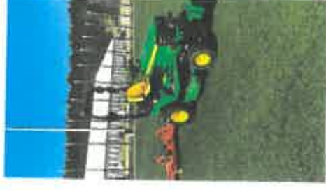
Kunstrasenplatz nach dem Striegeln