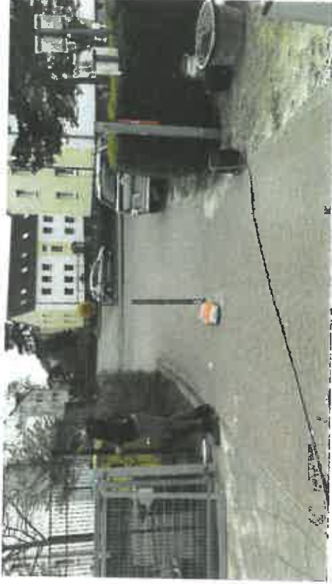
Einbau neue Toranlage Regionale Schule