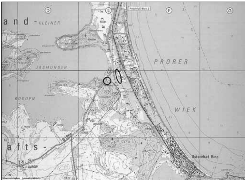
Übersichtsplan unmaßstäblich - 24. Änderung FNP