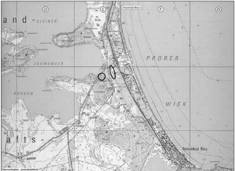
Übersichtsplatan unmaßstäblich - vB 20 „Umweltbildungszentrum Prora“