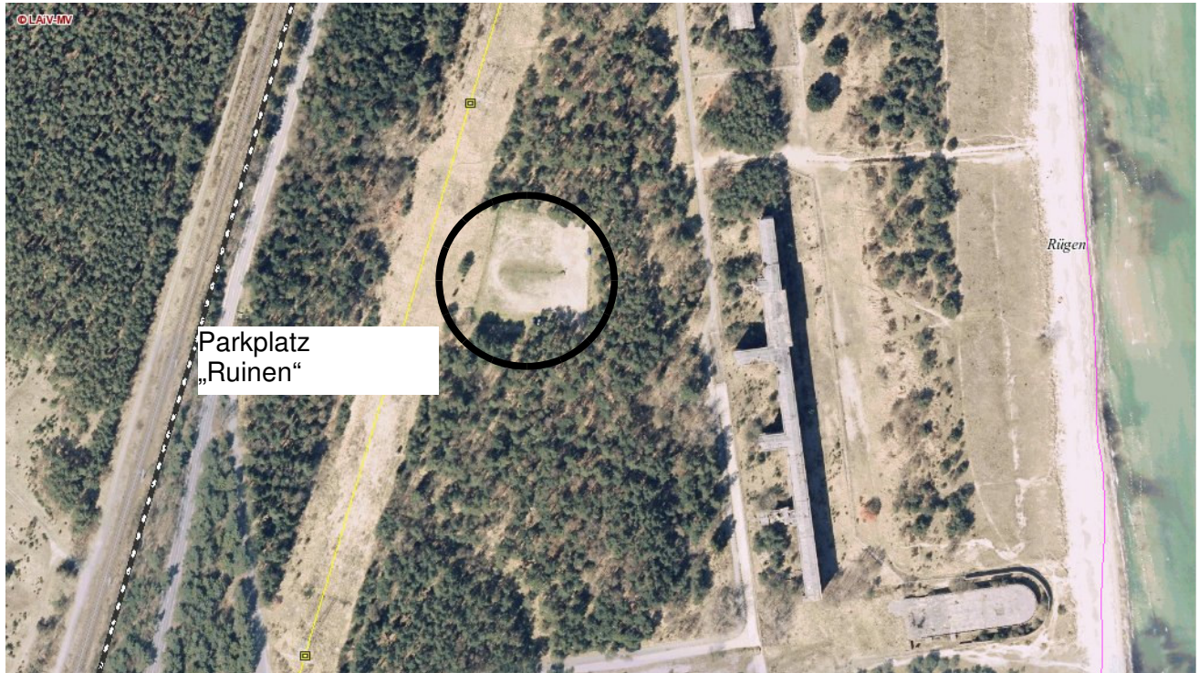
Abbildung 1: Luftbild ( http://www.umweltkarten.mv-regierung.de )

Das Plangebiet umfasst den Bereich des bestehenden Parkplatzes „Ruinen“, Teilfläche aus Flurstück 11/61 der Flur 6, Gemarkung Prora mit einer Gesamtfläche von 3.908qm zuzüglich Zufahrt.