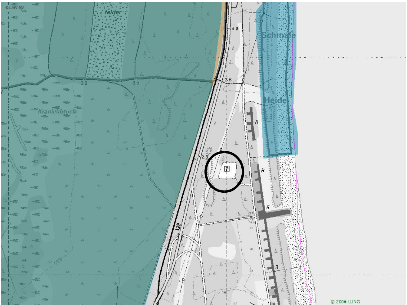
Abbildung 3: Natura 2000: Europ. Vogelschutzgebiet (braun) und FFH-Gebiet (blau).